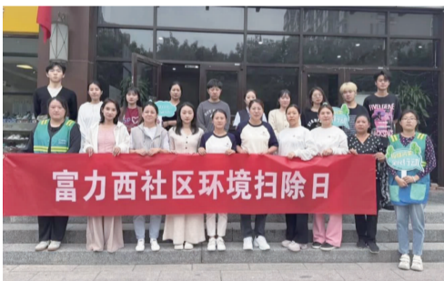
富力西社区环境扫除日

本次活动,既丰富了辖区居民的精神文化生活,更融洽了社区邻里关系,营造了一个睦邻友好的社区氛围。黄木厂社区将持续举办各类文化活动,提升居民的幸福感和获得感,增强社区的凝聚力和向心力。