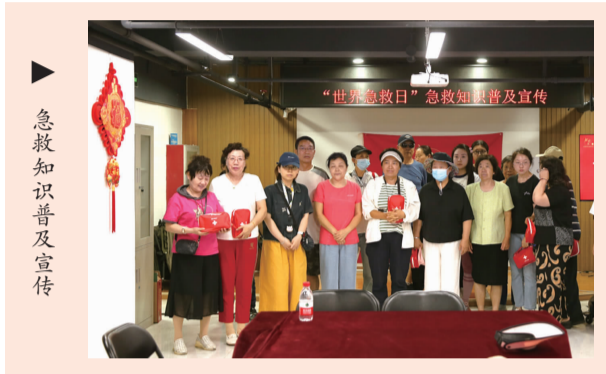
急救知识普及宣传