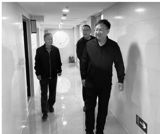
一行人在光华社区督导检查

暖,并表示,无论是辖区值守还是治安保障,志愿者们都表现出强烈的主人翁意识,为推进平安双井建设发挥了不可或缺的作用。