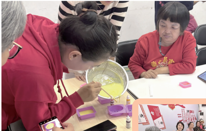
◀ 社区工作人员示范搅拌皂液

金秋十月,礼赞祖国。为庆祝中华人民共和国成立75周年,让辖区居民感受浓厚的国庆氛围,丰富居民文化生活、弘扬中华优秀传统文化,双井街道各社区举办了别开生面的多场活动,盛赞欢歌。 ■文/张思琪