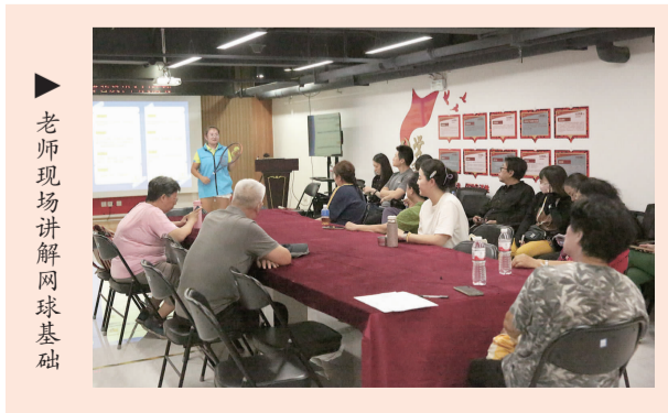
老师现场讲解网球基础