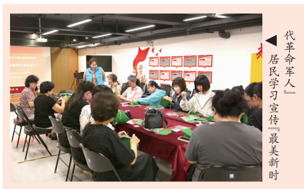
代革命军人 居民学习宣传“最美新时

此次活动的开展,不仅让辖区居民加深了对我国传统节日的认识,了解了中国传统节日中所蕴含的民族文化深厚内涵,同时也感受了文化的魅力,用兔灯表达吉祥安康、好运常伴的愿望。