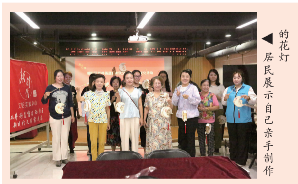
的花灯 居民展示自己亲手制作

接下来,双井街道文明实践所将持续关注居民健康,举办更多丰富多彩的活动,为居民们提供更多的学习和锻炼机会。同时,也会进一步发挥阵地作用,持续开展丰富多彩的志愿活动,不断延伸服务触角,把最暖心的服务送给最需要的人,让为民服务时时有,文明之花处处开。