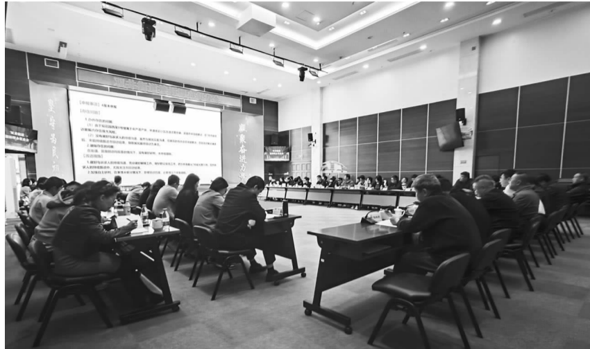
与会人员现场分析接诉即办案件

作工作部署:一是要坚持现有好经验好做法,扎实细致办件。二是要注重总结反思,发现问题及时整改。三是要紧盯假期安全,突发情况及时处理。