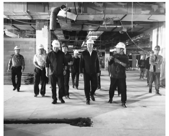
一行人了解九龙商厦生产经营情况

在九龙商厦项目现场,实地查看了建筑工地落实安全生产责任制、消防安全等情况,要求严格落实各项施工安全操作规范,强化从业人员安全教育培训,保障施工安全,有效防范和遏制事故发生。在百子湾南一路修路现场,听取了工程工期的施工进度等情况的汇报,现场察看了道路情况,叮